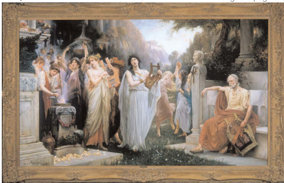
Vestali con filosofo