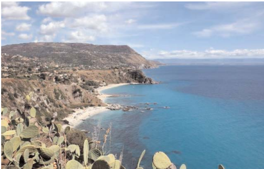
Capo Vaticano, baia grotticelle