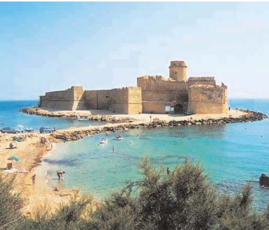
Isola Capo Rizzuto